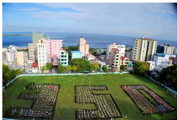
„Aerial photo with schoolchildren, Malé, Maldives., Quelle: http://www.flickr.com/photos/350org